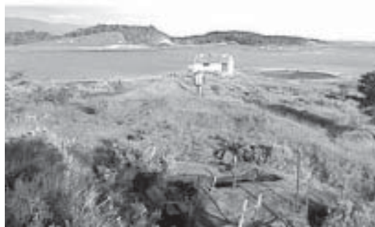
Fig. 10 Vista de Acatushún.

Es un entierro primario de un individuo adulto, depositado en un conchero extenso en las cercanías del casco de la Estancia Harberton a 4 m snm. y 40 metros de la costa (Fig. 10). Este esqueleto había sido detectado e inicialmente excavado por la Dra. Rae Natalie Prosser de Goodall, quien luego de exponerlo volvió a cubrirlo con materiales del conchero. Fue posible