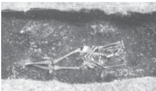
Fig. 11 Acatushún: vista del esqueleto (las flechas señalan la ubicación de los botones).

recuperar los límites de la excavación de Goodall, pero no pudimos visualizar otros rasgos asociados a esta inhumación. La posición del cuerpo era extendida, con las manos superpuestas sobre la pelvis y los miembros inferiores cruzados a la altura de los tobillos (Fig. 11). Los tarsianos y metatarsianos presentaban una leve dispersión, pero las restantes partes del esqueleto se encontraron anatómicamente articuladas. El cráneo estaba ausente debido a la actividad de aficionados en el lugar posteriormente a la intervención de la Dra. Goodall, cuyas fotografías revelan que en la década del '70 el cráneo aún se conservaba en su posición primaria. Todos los elementos presentan un grado de preservación excelente: no se observaron fracturas ni otros indicios de modificación ósea. Asociado a la columna vertebral se encontraron seis botones, lo cual permite inferir que el entierro corresponde a momentos históricos.