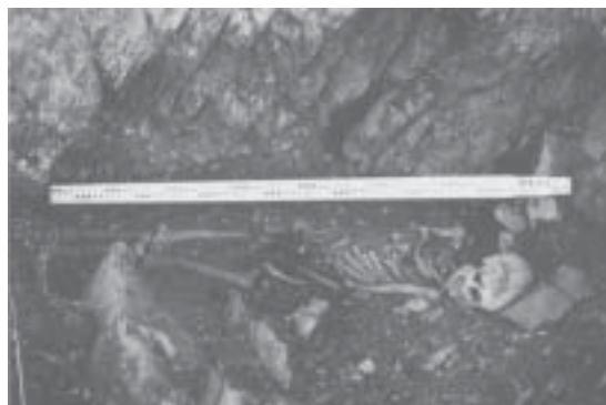
Fig. 9 Paiashauia 1: vista del esqueleto.