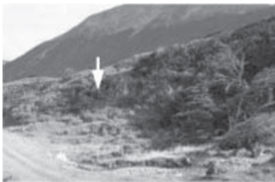
Fig. 8 Vista de Paiashauia 1 (la flecha indica la ubicación del sitio excavado).