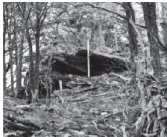
Fig. 3 Imiwaia Entierro 2.

La edad del individuo se determinó mediante la medición de sus huesos (Scheuer y Black 2000). Los elementos disponibles para efectuar esta tarea fueron: clavícula, escápula, húmero y