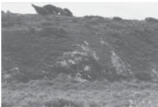
Fig. 4 Shamakush Entierro: vista general del alero.

Es un alero que se encuentra dentro de la localidad arqueológica Shamakush, a unos 670 m de la costa y 5 msnm (Fig. 4). El contexto mortuorio ubicado dentro de este abrigo rocoso había sido inicialmente localizado y parcialmente perturbado por la actividad de aficionados. Esto exigió que en 1994 se realizaran las primeras recolecciones con el fin de conservar el material removido y expuesto en superficie. Durante este reconocimiento se recuperaron huesos pertenecientes a tres individuos, dos adultos y un