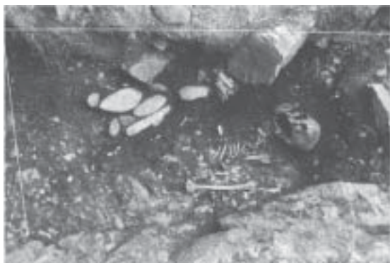
Fig. 5 Shamakush Entierro: vista de SHE 6 con artefactos líticos asociados.