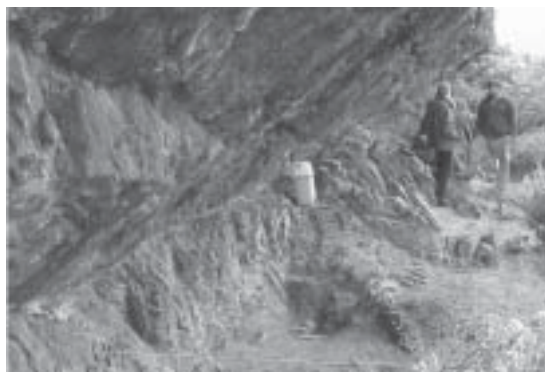
Fig. 6 Mischiuen III: vista del interior del alero.

de un mínimo de cinco individuos para este contexto. Asimismo resulta difícil definir si existió sincronidad en la depositación de los cuerpos. No obstante, consideramos que al menos una reutilización de este alero se pudo haber dado con SHE 6, lo cual a su vez pudo haber contribuido a la desarticulación de los esqueletos allí emplazados previamente.