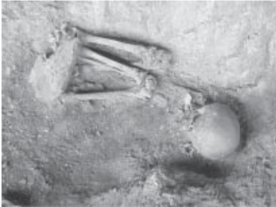
Fig. 7 Mischiuen III: vista del individuo 1.

Dado que la señal isotópica de la relación ^{13}\text{C}/^{12}\text{C} (11.1‰; AIE11720) 9 indica una alimentación compuesta predominantemente por recursos marinos (Tessone et al. 2003), la cronología señalada debe estar afectada por Efecto Reservorio. Para la región del canal Beagle, este factor fue estimado en aproximadamente 600 años (Albero et al. 1986 y 1988). No obstante, allí no toda la fauna marina se encuentra influida con la misma intensidad; dependiendo de las condiciones microambientales los moluscos pueden generar distintas señales isotópicas e incluso no mostrar Efecto Reservorio alguno (Albero et al. 1988, Bogomil et al. 1998). Por otro lado, la fauna marina –si bien dominante en la dieta– no necesariamente debe haber sido la única clase de ingesta. Por ende consideramos que la cronología señalada constituye una edad máxima a la que debe descontarse un rango no estimable de Efecto Reservorio inferior a 600 años.