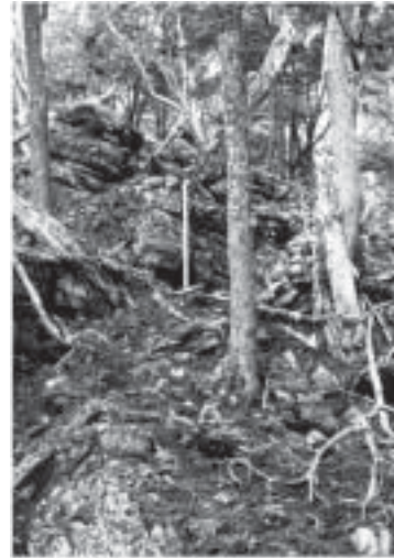
Fig. 2 Imiwaia Entierro 1.

en algunas porciones. En este sector del registro también se hallaron dos especímenes óseos que no pudieron ser determinados anatómicamente.