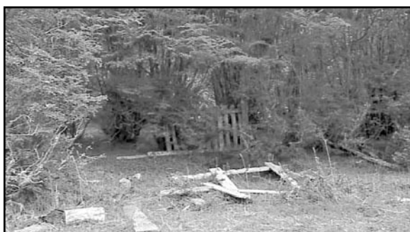
Fig. 8: Estado actual de la misma tumba (fotografía año 2004).