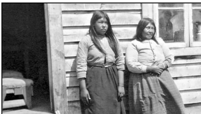
Fig.5: Las mismas mujeres de la Figura 4.