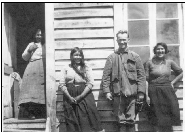
Fig. 3: Las mismas mujeres con el fotógrafo de la toma anterior.