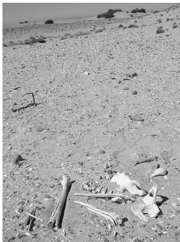
Fig. 2. Fotografía del entierro Punta Buque 3.

El estudio del sedimento asociado al entierro se realizó en el IGS-CISAUA (Instituto de Geomorfología y Suelos-Centro de Investigaciones en Suelos y Agua de uso agropecuario, perteneciente a la Universidad Nacional de La Plata). Las variables analizadas fueron contenido porcentual de materia orgánica carbono orgánico y nivel de pH.