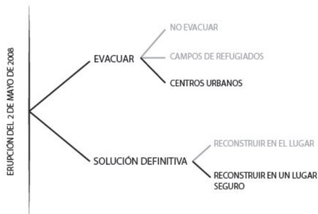
Fig. 3. Árbol de decisiones básicas tomadas en la gestión de la catástrofe.

En junio de 2008 regresan masivamente chaiteninos a recoger enseres y constatan la gravedad de los daños y pérdidas, ahí surgen críticas